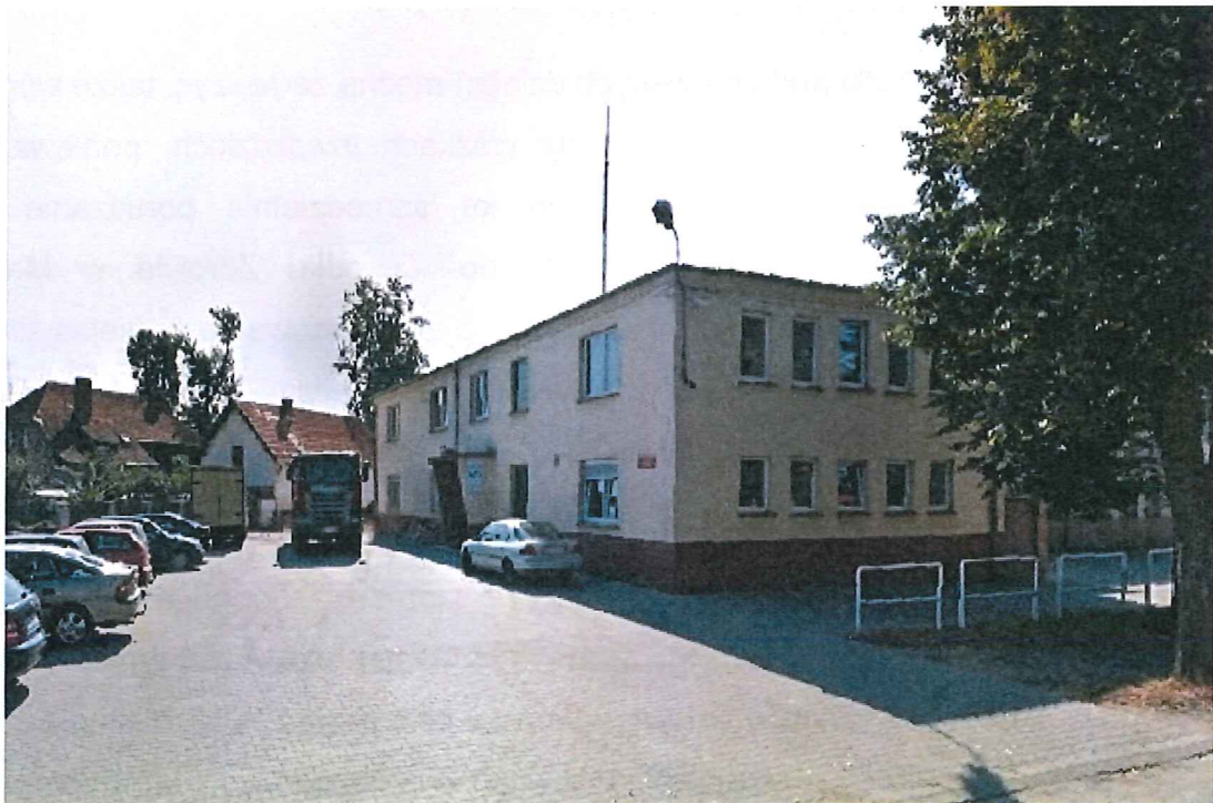
Rysunek 9: Budynek OSP w Mroczeniu.