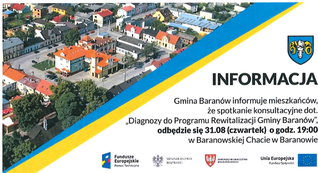
Rysunek 12: Zaproszenie na konsultacje społeczne w Baranowie