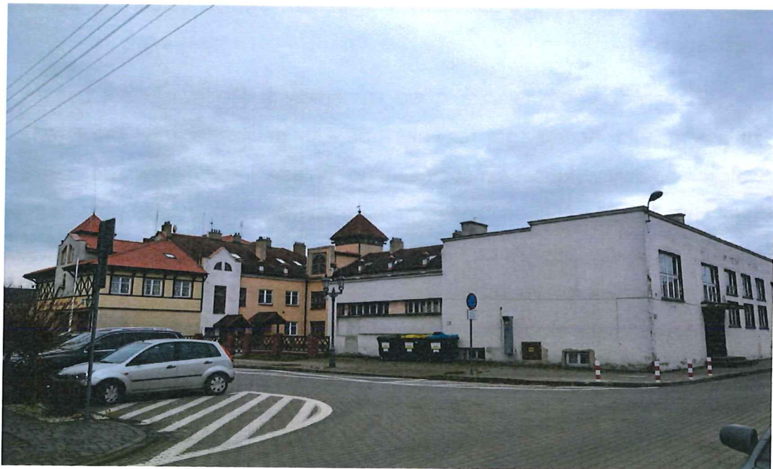
Rysunek 5: Rynek w Baranowie.