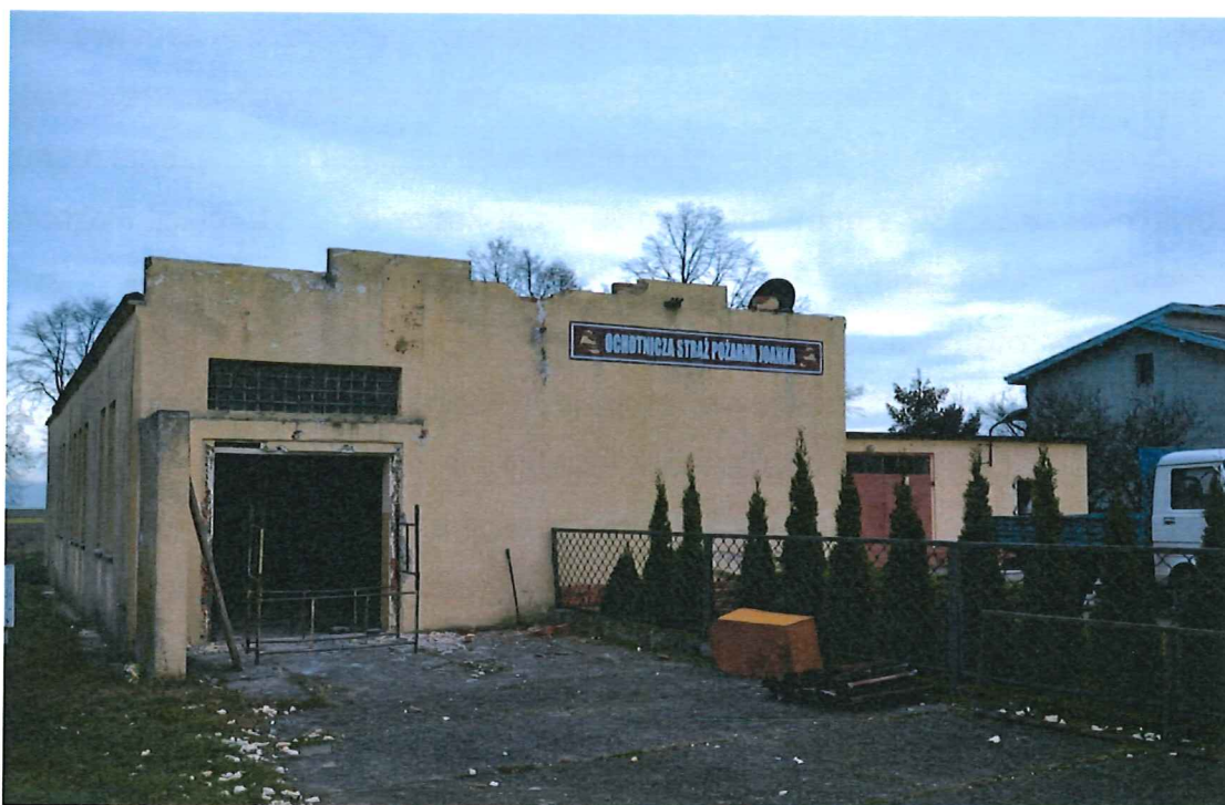
Rysunek 7: Dom Ludowy w Joance.