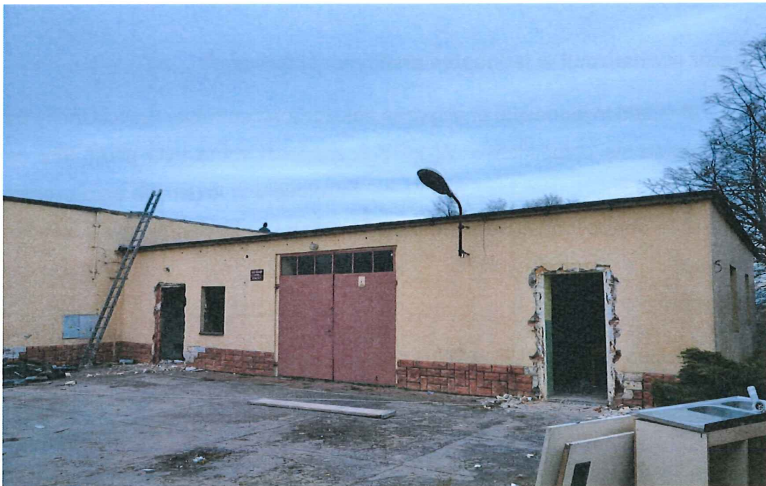
Rysunek 6: Dom Ludowy w Joance.

miejsowości Joanka wydzielono chodnik zapewniający bezpieczeństwo dla ruchu pieszych, jednak na terenie całej jednostki nie ma wydzielonych ścieżek rowerowych - ruch rowerowy odbywa się poboczem drogi, a ze względu na natężenie ruchu (droga powiatowa nr 5693P stanowi połączenie drogi krajowej nr 11 relacji Poznań-Bytom z centrum Mroczenia) istnieje wysokie ryzyko wypadkowe, zwłaszcza z udziałem rowerzystów. Często widokiem są również dzieci i młodzież, którzy w okresie wiosenno-jesiennym na rowerach docierają do szkół w Łęce Mroczeńskiej i Mroczeniu. Dodatkowo obszaru rewitalizacji nie obejmuje żadna sieć komunikacji zbiorowej, zapewniającej połączenia autobusowe z pozostałymi miejscowościami sołectkami Gminy i miastem powiatowym (najbliższy przystanek autobusowy zlokalizowany jest we wsi Mroczeń). Sieć połączeń autobusowych zlikwidowano w pierwszej połowie lat 90-tych XX wieku. Na terenie obszaru rewitalizacji funkcjonuje przystanek autobusowy wybudowany przez Gminę Baranów, stanowi on jednak jedynie punkt zbiorczy dla uczniów, którzy dowożeni są do szkół w Łęce Mroczeńskiej i Mroczeniu.