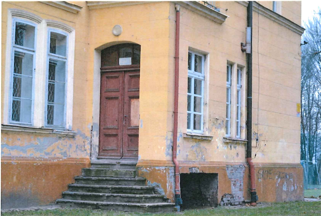
Rysunek 8: Pałac Feliksa Wężyka w Mroczeniu.