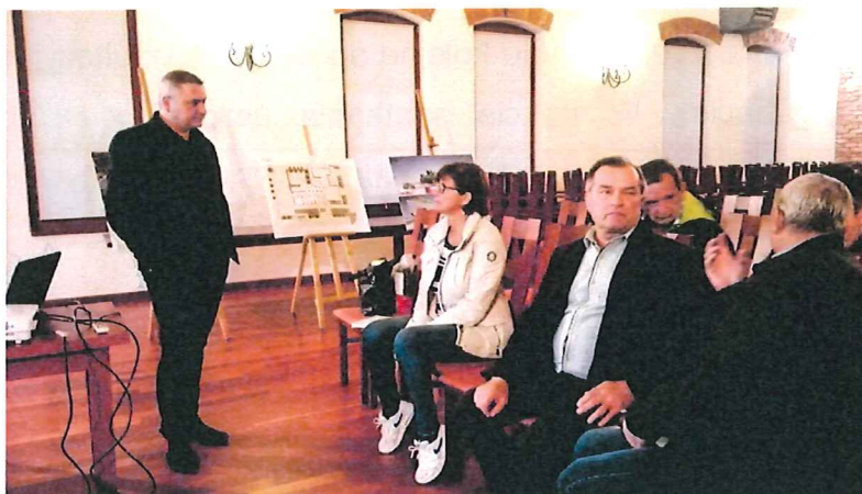
Zdjęcie 2: Konsultacje społeczne w Baranowie