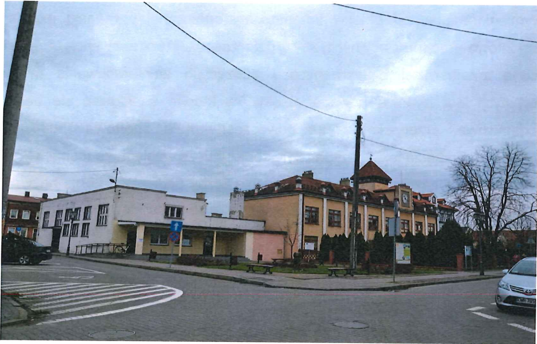
Rysunek 4: Rynek w Baranowie.

z organizacją różnego rodzaju przedsięwzięć na terenie Gminy i miejscowości oraz mogą mieć łatwiejszy dostęp do niektórych grup społecznych.